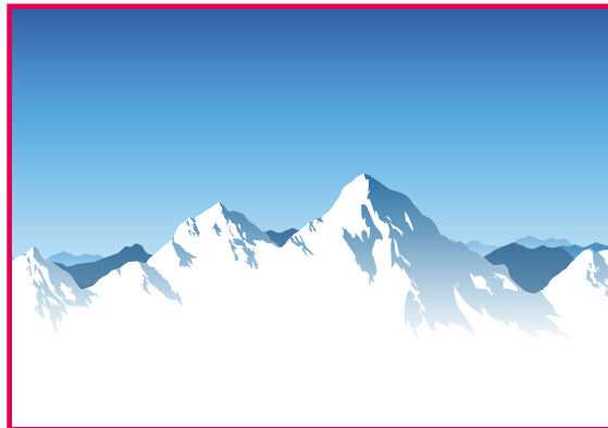
2 Samúéil 22 – Laoi Dháiví